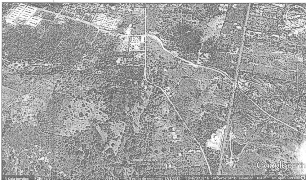
Imagen satelital N° 1 - año 2016